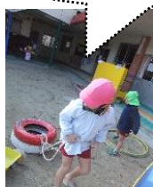
タイヤの2個運び!結構重いです(；ω；)