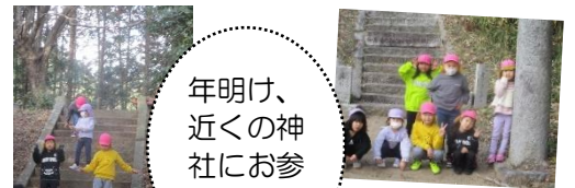
年明け、近くの神社にお参りに♪