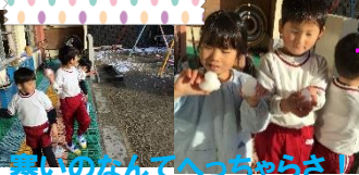
寒いなんてへっちゃらさ！